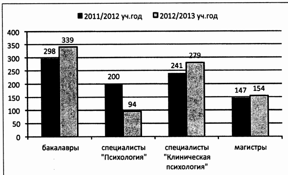
Рис. 1. Контингент студентов очной формы обучения

На начало сессии контингент студентов очной формы обучения на факультете психологии составлял 866 человек (из них 339 студентов обучаются по программе подготовки бакалавра, 373 студента обучаются по специальности 030301 и 030302 и 154 магистранта). На рисунке 1 отображено сравнение с зимней промежуточной аттестацией 2011/2012 учебного года.