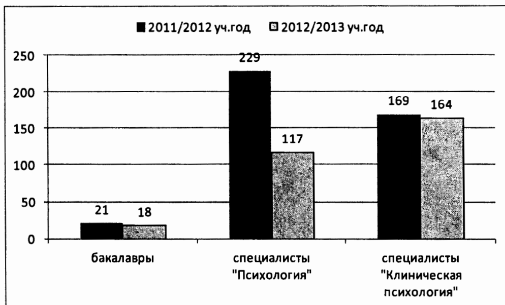
Рис.2. Контингент студентов очно-заочной (вечерней) формы обучения

Контингент студентов очно-заочной формы обучения составлял 299 человек (рис.2) (из них 18 студентов обучаются по программе подготовки бакалавра, 117 студентов обучаются по специальности 030301 и 164 студента - по специальностям 030302, 030401).